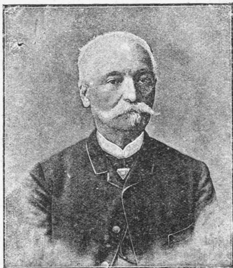
ΣΩΤΗΡΙΟΣ ΣΩΤΗΡΟΠΟΥΛΟΣ πρωθυπουργός

—Ἐν Τεργέστη ὑπὸ τοῦ κ. Ἀλεξάνδρου Σ. Βυζαντίου ἐξεδόθησαν εἰς τόμον ὀγκώδη καὶ πολυτελεῖ τὰ Ἔργα τοῦ ἄρτι ἀποβιώσαντος κλεινοῦ δημοσιογράφου Ἀναστασίου Βυζαντίου, τὰ ἐν τῇ «Νέᾳ Ἡμέρᾳ» καὶ ἄλ-