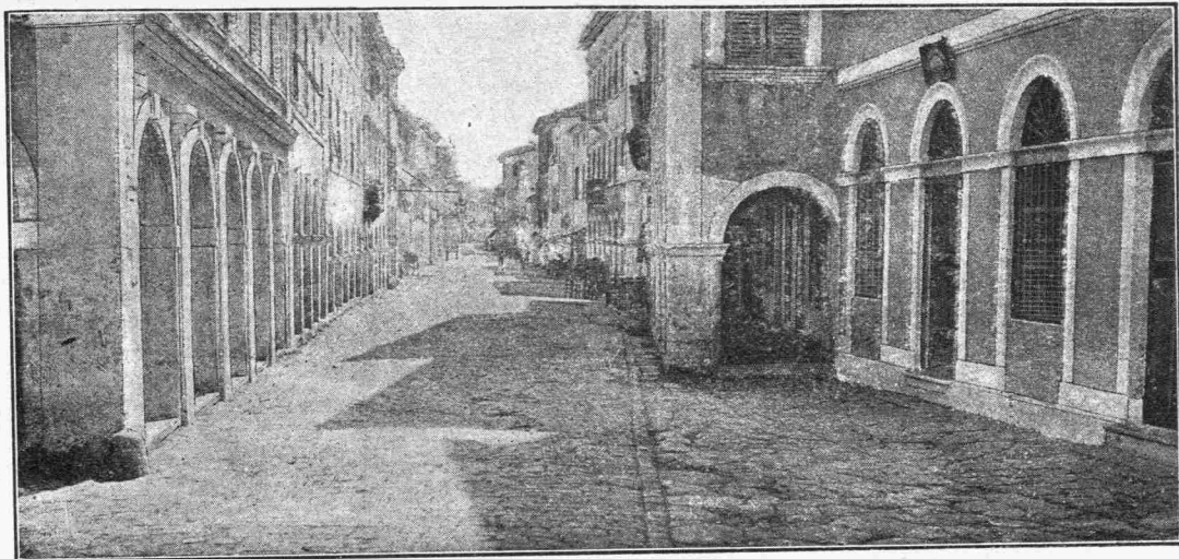
Ἡ Πλατεῖα Ρούγα