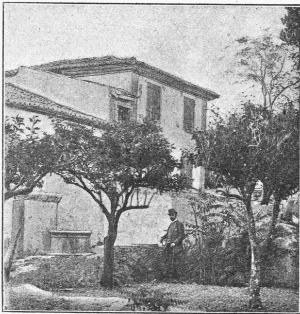
Η κατοικία του Σολωμού

λειπτος δόννησις του εδάφους καταρρίπτει τά απομεινάρια εκείνα των τοίχων, και έξαλείφει και τήν τελευταίαν ακόμη έλπίδα. Αί όδοι πολλαχού καταντούν άδιάβατοι εκεί όπου άλλοτε διήρχοντο οι έρασταί ζητούντες τούς θελκτικούς όφθαλμούς βρεμβαζούσης κορασίδος, τώρα περιδεείς διαβαίνουν προσέχοντες εις τά βήγματα των οικιών, εις τας σαλευομένας δοκούς, εις τούς εξηρηρωμένους έξώστιας. Άλλ' ή άγάπη του οικου υπερισχύει ένιστε του κινδύνου και βλέπετε μέσα εις εκείνους τούς αίωρουμένους τοίχους, διαμενούσας ακόμη οικογενείας αίτινες άπεφάσισαν να ταρῶσι μετά των οικιών των μάλλον ή να έγκαταλείψωιν αυτάς, ζη-