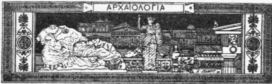
ΓΕΡΜΑΝΙΚΗ ΑΡΧΑΙΟΛΟΓΙΚΗ ΣΧΟΛΗ