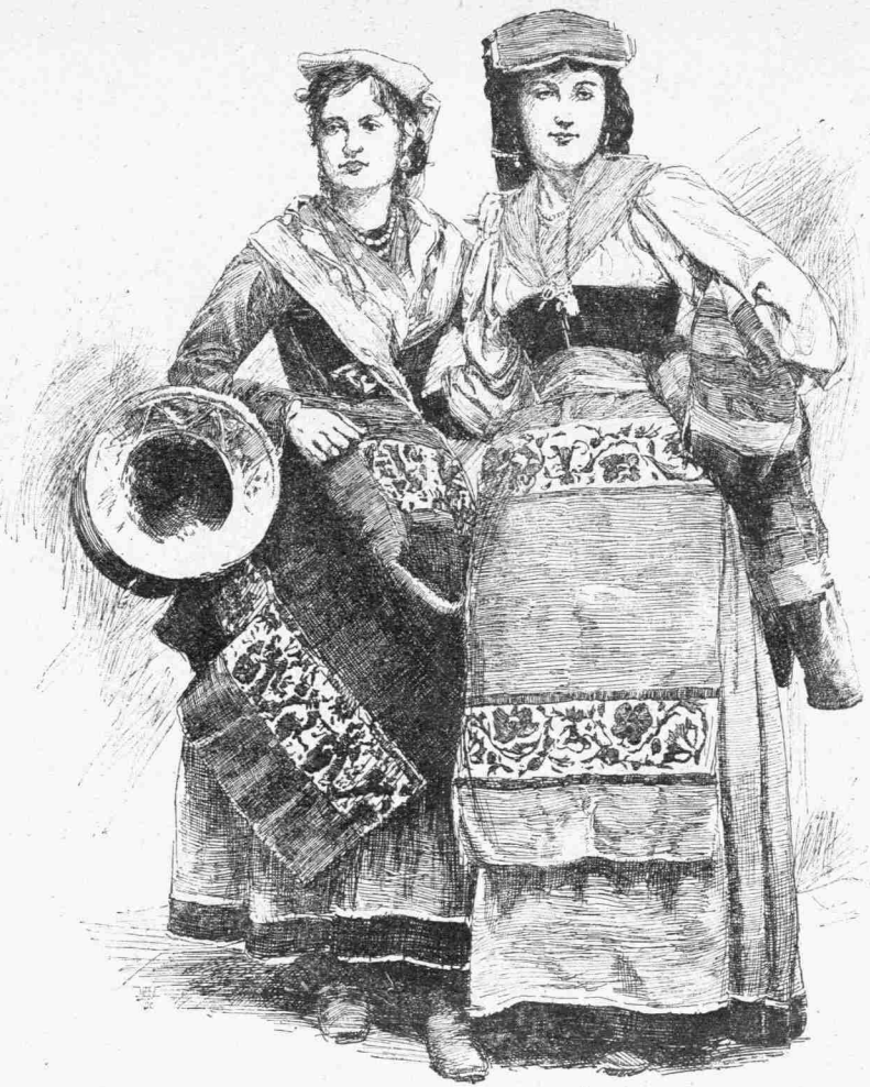
ΓΥΝΑΙΚΕΣ ΕΚ ΤΗΣ ΠΕΡΑΝ ΤΟΥ ΤΙΒΕΡΕΩΣ ΧΩΡΑΣ

ἔθηκε τὸ ζήτημα, ὅπερ ἔδωκεν ὀριστικὴν ῥοπήν εἰς τὰς τύχας τῆς. Μέχρι τίνος βαθμοῦ θὰ ἠδύνατο νὰ ἐπωφεληθῆ τὴν ἀρχαίαν τέχνην; ἔπρεπε νὰ εὑρηθῆ διὰ τὰ νέα τῆς δόγματα νέας παραστάσεις; ἢ θὰ ἠδύνατο ἀφόβως καὶ ἐλευθέρως νὰ δανεισθῆ ὅ,τι εἰς αὐτὴν ἐχρειάζετο ἀπὸ τῶν καλλιτεχνῶν τοῦ παρελθόντος; ἢ ὡς πρὸς τὴν λεγομένην κοσμητικὴν ζωγραφίαν οἱ χριστιανοὶ δὲν εἶχον νὰ διστάσωσι, δὲν ἔβλεπον τί τὸ κακὸν εἰς τὸ νὰ κοσμῶσι τοὺς τοίχους διὰ κομψῶν ἀραβουργημάτων καὶ νὰ ρίπτωσιν ἐδῶ καὶ ἐκεῖ φανταστικὰ πτηνὰ ἢ πτερωτοὺς δαίμονας ἐν τῷ μέσῳ ἀνθοπλέκτων στεφάνων. Οὕτω δὲ ἀναπαρήγαγον ἀμετάβλητα τῆς παλαιᾶς τέχνης τὰ ὑποδείγματα καὶ διὰ τοῦτο ἀνευρίσκομεν τώρα εἰς τοὺς κευθμῶνας τῶν νεκρῶν χαριέστατα ὁροφῶν ποικίλματα, τὰ ὅποια ὑπενθυμίζουσιν εἰς τὸν περιηγητὴν τὰ ὁροφώματα τῆς Πομπηίας. Ἀλλὰ τὸ πρᾶγμα καθίστατο δυσχερέστερον ὅταν οἱ Χριστιανοὶ ἤθελον νὰ φιλοτεχνήσωσιν ὄχι πλέον κοσμήματα καὶ ποικίλματα, ἀλλ' εἰκόνας ἀληθεῖς, τὴν δὲ δυσχερείαν ταύτην ἐλέγχει ἡ συνήθεια ἣν ἔλαβον τοῦ νὰ ἀπεικάζωσι πάντοτε τὰ αὐτὰ θέματα. Τινὰ ἐκ τῶν θεμάτων τούτων παρεῖχεν εἰς αὐτοὺς ἡ Παλαιὰ Διαθήκη καὶ ταῦτα ἐξηκολούθουν διηλεκτικῶς νὰ ἀναπαριστῶσι κατὰ τὴν αὐτὴν πάντοτε τεχνολογίαν τὸν Μωϋσῆν ἐξάγοντα ὕδωρ ἐκ τῆς πέτρας, τοὺς τρεῖς Ἑβραίους ἐν τῇ καμίνῳ, ὧν τὸ παράδειγμα