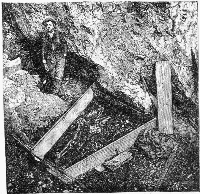
Οἱ εὑρεθέντες σκελετοὶ

Οἱ σκελετοὶ οὗτοι τρεῖς τὸν ἀριθμὸν εὐρίσκονται εἰς ἀπόστασιν 18 μέτρων ἀπὸ τῆς εἰσόδου τοῦ σπηλαίου ἔχοντος βάθος μέτρα 31,50 κατὰκεινται· πλαγίως ἀλλήλων καὶ ἐγκαρσίως τοῦ ἐσωτερικοῦ τοῦ σπηλαίου, ἐνῶ οἱ ἀνακαλυφθέντες κατὰ τὰ 1872, 1873 καὶ 1875 ἔκειντο κατὰ τὴν