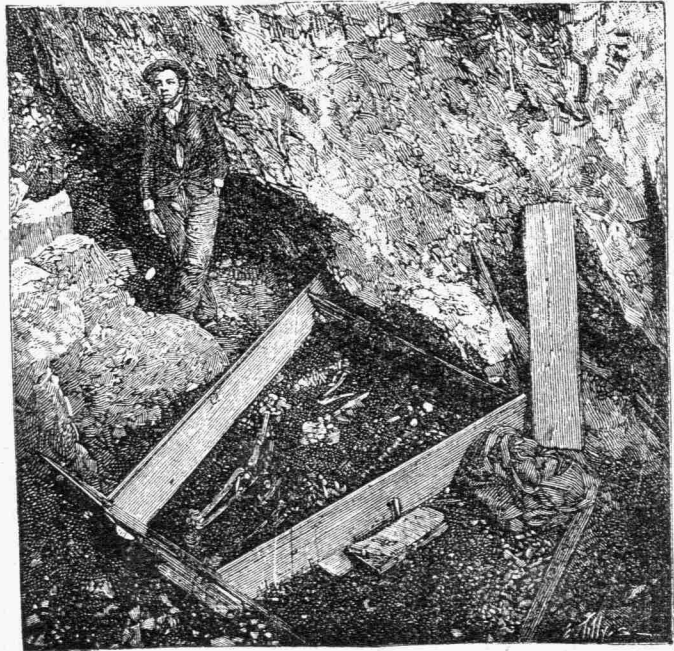
Οἱ εὐρεθέντες σκελετοὶ

Οἱ σκελετοὶ οὗτοι τρεῖς τὸν ἀριθμὸν εὐρίσκονται εἰς ἀπόστασιν 18 μέτρων ἀπὸ τῆς εἰσόδου τοῦ σπηλαίου ἔχοντος βάθος μέτρα 31,50 κατὰκεινται· πλαγίως ἀλλήλων καὶ ἐγκαρσίως τοῦ ἐσωτερικοῦ τοῦ σπηλαίου, ἐνῶ οἱ ἀνακαλυφθέντες κατὰ τὰ 1872, 1873 καὶ 1875 ἔκειντο κατὰ τὴν