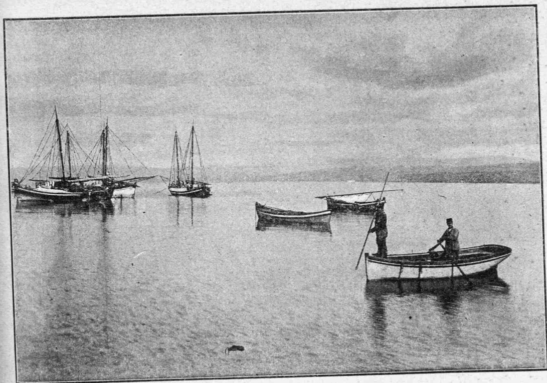
ΘΑΛΑΣΣΟΓΡΑΦΙΑΙ ΕΚ ΤΟΥ ΛΙΜΕΝΟΣ ΤΗΣ ΠΥΛΟΥ