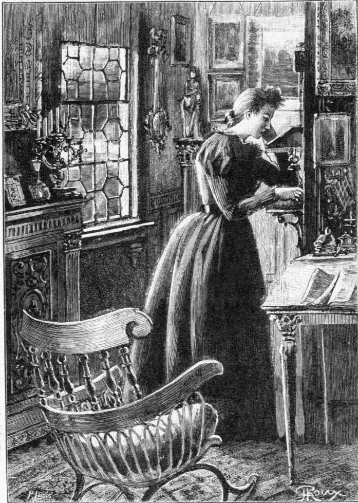
Δὲν ἀνεγνώρισατε τὴν φωνὴν μου ; (σελ. 234).

Ναυκηγῆσαντος τοῦ Πρωτέως , ἔμειναν ἔρημοι ἐκτεθειμένοι εἰς παντοίας κακουχίας, εἴκοσι τέσσαρες ἄνδρες, ἄποικοι τρόπον τινὰ τῶν ἀξένων ἀρκτικῶν χωρῶν. Ὁ ἰατρός Παβύ, Γάλλος τὸ γένος, καὶ πλεῖστοι ἄλλοι θνήσκουσιν, ὃ δὲ Γρηῖλυ, διαφυγὼν τὸν θάνατον, χάρις εἰς τὴν βοήθειαν ἣν ἐκόμισεν αὐτῷ ἡ Θέτις ἐν ἔτει 1883, μόνον ἐξ τῶν συμπλωτῆρων τοῦ ἐπαναφέρει. Εἰς δὲ τῶν ἠρώων τοῦ πλοῦ ἐκείνου, ὃ ὑποπλοίαρχ-