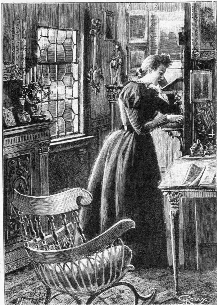
Δὲν ἀνεγνώρισάτε τὴν φωνὴν μου ; (σελ. 234).

Ναυκηγήσαντος τοῦ Πρωτέως , ἔμειναν ἔρημοι ἐκτεθειμένοι εἰς παντοίας κακουχίας, εἴκοσι τέσσαρες ἄνδρες, ἄποικοι τρόπον τινὰ τῶν ἀξένων ἀρκτικῶν χωρῶν. Ὁ ἰατρός Παβύ, Γάλλος τὸ γένος, καὶ πλεῖστοι ἄλλοι θνήσκουσιν, ὃ δὲ Γρηῖλυ, διαφυγὼν τὸν θάνατον, χάρις εἰς τὴν βοήθειαν ἣν ἐκόμισεν αὐτῷ ἡ Θέτις ἐν ἔτει 1883, μόνον ἐξ τῶν συμπλωτῆρων τοῦ ἐπαναφέρει. Εἰς δὲ τῶν ἡρώων τοῦ πλοῦ ἐκείνου, ὃ ὑποπλοίαρχ-