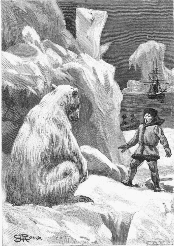
Ὁ Πόλος θεωρεῖτο ἀπρόσιτος εἰς τὸν ἄνθρωπον. (σελ. 148)

εἰ καὶ τὸ πνεῦμά μου μετὰ τρόμου τὸ ἐνθυ-μεῖται. ὡς λέγει ὁ Βιργίλιος. Θὰ ἦτο ὅμως ἀν-ανδρία, οὕτως εἰπεῖν, ἂν ἀπέφευγα ν' ἀνοίξω