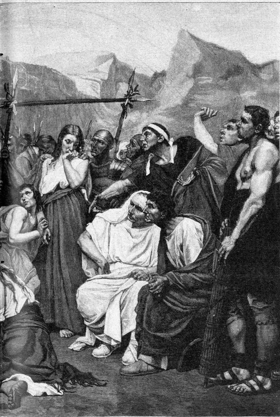
ΣΙΣ ΔΟΥΛΩΝ ΕΝ ῬΩΜΗ Κόττε

λεγεωνάριοι, ὧν εἰς μὲ τὰς δύο χεῖρας καὶ ὡσεὶ μετὰ κόπου κρατεῖ τὴν βραχεῖαν ῥάβδον, ἥτις ἀνέχει ἐστεφανωμένην τὴν σημαίαν τῆς λεγεῶνος. Δύο δὲ στρατιῶται μεταξὺ σχεδὸν τῆς τραπέζης καὶ τῶν υπερθεματιζόντων ἐμπόρων, ἐξ ὧν καὶ ἄλλοι διακρίνονται πλὴν τῶν τεσσάρων πρώτων, κρατοῦσιν ὑψηλὰ καὶ καθέτως ἕκαστος ἀνά ἐν δόρυ, πρὸς ἃ εἶναι κατὰ τὰς ἄκρας προσδεδεμένοι ὀριζοντίως τρίτον ἄλλο συναποτελοῦν ζυγὸν ὁμοίον πρὸς ἐκεῖνον ὑπὸ τὸν ὅποιον καὶ