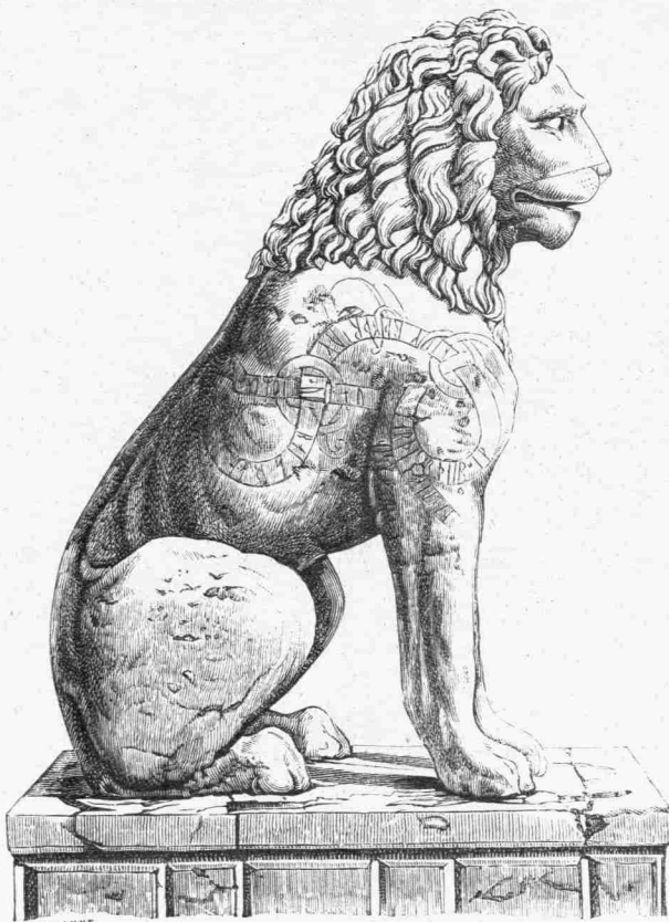
Ὁ λέων τοῦ Πειραιῶς μετὰ τοῦ δεξιοῦ ἡμισθεῶς τῆς ρουνικῆς ἐπιγραφῆς.