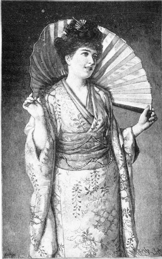
ΤΟ ΑΝΘΟΣ ΤΗΣ ΙΑΠΩΝΙΑΣ

δύναμιν, ὥστε αὕτη δύναται τὸ αὐτὸ βάρους τοῦ ἄνθρακος νὰ ἐκσφενδονήσῃ τετρακόσια μίλλια πρὸς τὰ ἄνω. Κατὰ τὸ ἔτος 1877 μόνον ἐν Γερμανίᾳ ἀνορύχθη ποσότης λιθάνθρακων, ἧς ὁ ὄγκος εἶναι δέκα καὶ τετράκις μεγαλειότερος ἀπὸ τὴν πυραμίδα τοῦ Νέοπος. Διὰ τὴν ἐργασίαν, τὴν ὁποῖαν διὰ τῶν ἄνθρακων τῆς παραγωγῆς τοῦ ἔτους τούτου δύναμεθα νὰ ἐκτελέσωμεν, ἠθέλωμεν ἔχει ἀνάγκην δυνάμεως 150 ἑκατομμυρίων ἵππων δι' ὅλοκληρον ἔτος ἐκ 300 ἡμερῶν καὶ ὀκταῶρου ἡμερη-