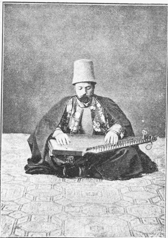
ΟΘΩΜΑΝΟΣ ΠΑΙΖΩΝ ΣΑΝΤΟΥΡΙ