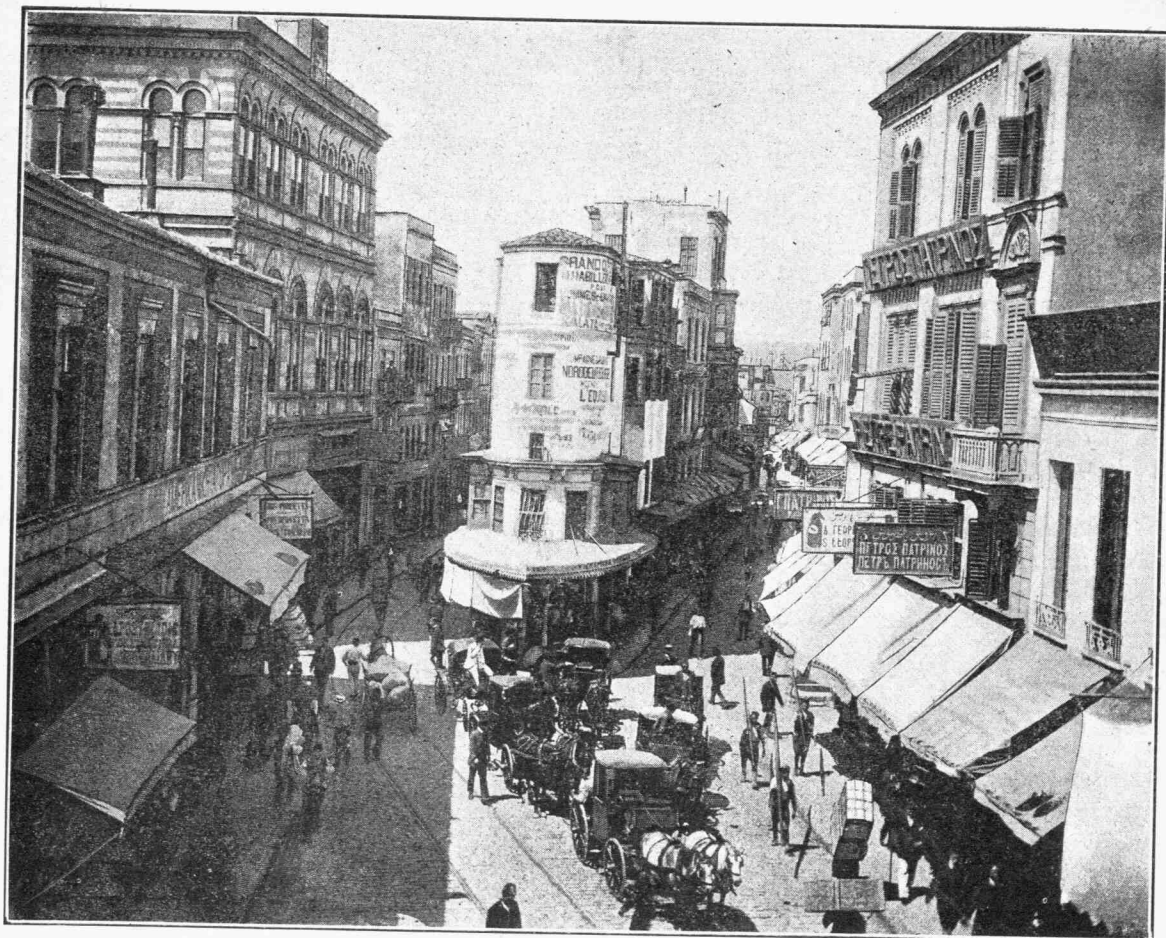
Ο ΓΑΛΑΤΑΣ ΤΗΣ ΚΩΝΣΤΑΝΤΙΝΟΥΠΟΛΕΩΣ

χεῖρα Α Σ μεθ' ἐνὸς σταυροῦ. Ὁρῆος καὶ κατη- φῆς ἐν τῇ ἐρημίᾳ ἐκείνῃ, ὅτε μὲν ἀνυψούμενος, ὅτε δὲ ταπεινούμενος ἐκ τῆς σφοδρᾶς κινήσεως τῆς πύμνης, ὡς νὰ ὠρχεῖτο εἰς τὸν ἀέρα, ἐφαί- νετο οἰονεὶ ἢ εἰκὼν, ἢ ἐνσάρκωσις πασῶν τῶν θλίψεων καὶ τῶν συμφορῶν τῶν συσσωρευμένων ἐπὶ τοῦ πλοίου, τὸ ζῶν σύμβολον τῆς πλανήτι- δος ὑπάρξεως ὡς καὶ τοῦ ἀβεβαίου μέλλοντος πάν- των. Μία μόνη γυνὴ εὗρίσκετο εἰς ἐκεῖνο τὸ μέ- ρος, μία γραῖα καθημένη ἐπὶ προέχοντος στρογ- γύλου ξύλου, πλησίον τοῦ ἐπίσης προσβύτου συ- ζύγου τῆς. Ἀμφότεροι ἴστατο μετὰ τοὺς βραχίονας ἐσταυρωμένους ἐπὶ τῶν γονάτων καὶ τὴν κεφα- λὴν κεκυφίαν τοσοῦτον, ὥστε δὲν ἐφαίνετο ἡ μορφὴ των, ἀλλὰ μόνον ἡ μιζοπόλιος καὶ ἀραιὰ κόμη των καὶ δύο τράχηλοι ἐρρυτιδωμένοι, δει- κνύοντες ὅτι οἱ προσβύται εἶχον ὑπερβῆ τὸ ἐβδο- μηκοστὸν ἔτος τῆς ἡλικίας των, τεταμένοι ἐν στάσει ἀθυμαίας καὶ κοπώσεως θανασίμου. Πρὸς τί μετέβαινον εἰς Ἀμερικὴν; Πρὸς συνάντησιν τῶν τέκνων των ἴσως. Οὐδὲν ἄλλο ἕως τότε εἶ- χον ἴδει θέαμα θλιβερώτερον ἐπὶ τοῦ πλοίου ἀπὸ τὸ διπλοῦν ἐκεῖνο καὶ κατεσκληκὸς γῆρας, τὸ