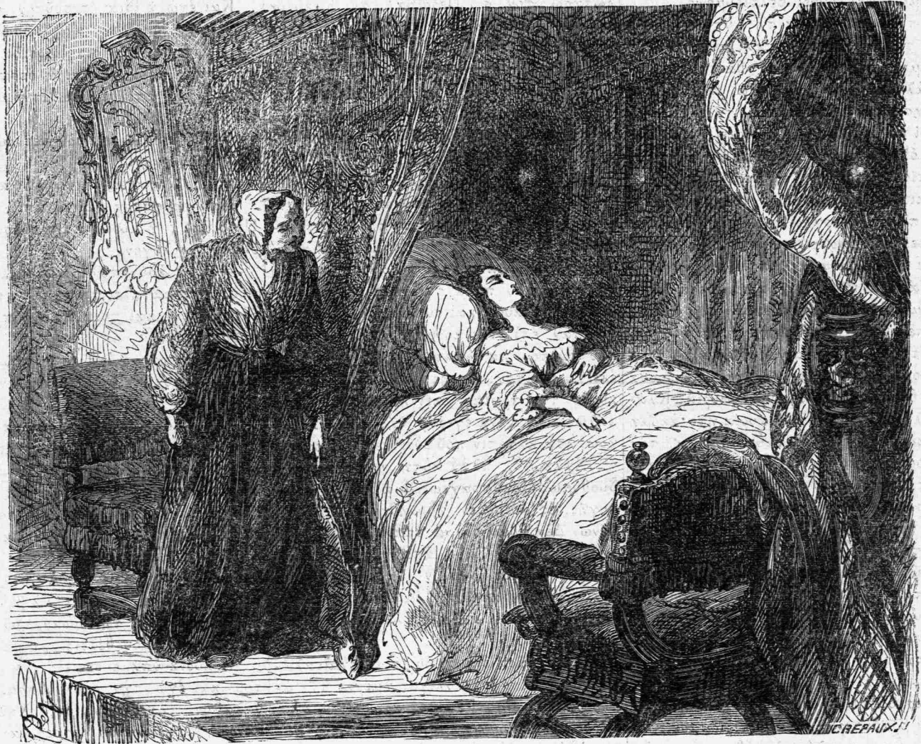
Τὴν παρητήρησα κτακεκλιμένην ἐπὶ τῆς εὐρείας κλίνης. (Σελ. 123).

Ἐν Ἀθήναις: φρ. 5, ἐν ταῖς ἰσχυρίαις 6 Ἐν τῇ ἑξωτερικῇ φρ. χρυσῶ 10. Ἐν Ῥωσσίᾳ ρούβλια 4. ΦΥΛΑΑ προηγούμενα λεπτὰ 20.