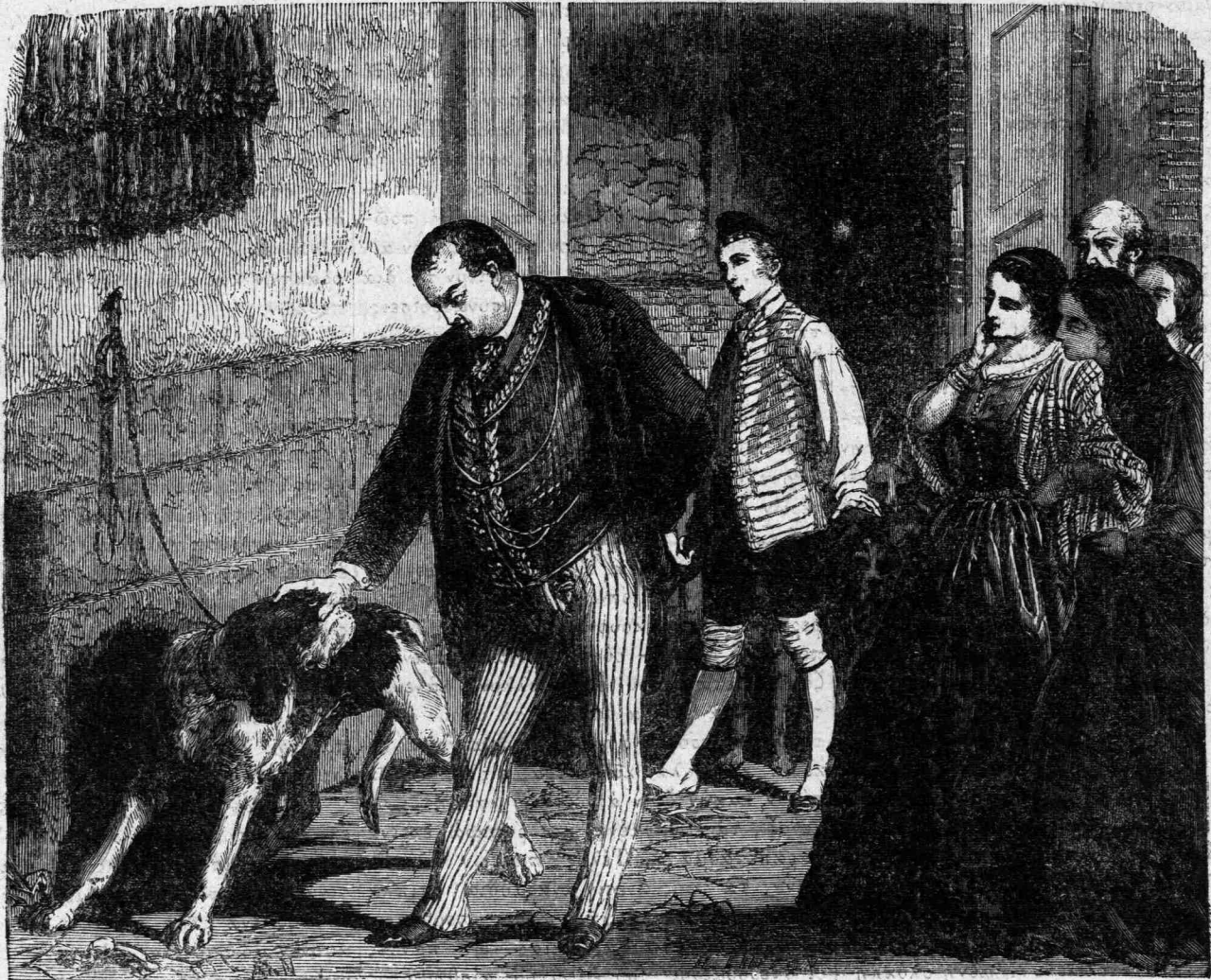
Ἀπέθηκε τοὺς δακτύλους του ἐπὶ τῆς κεφαλῆς τοῦ φοβεροῦ ζώου. (Σελ. 12).