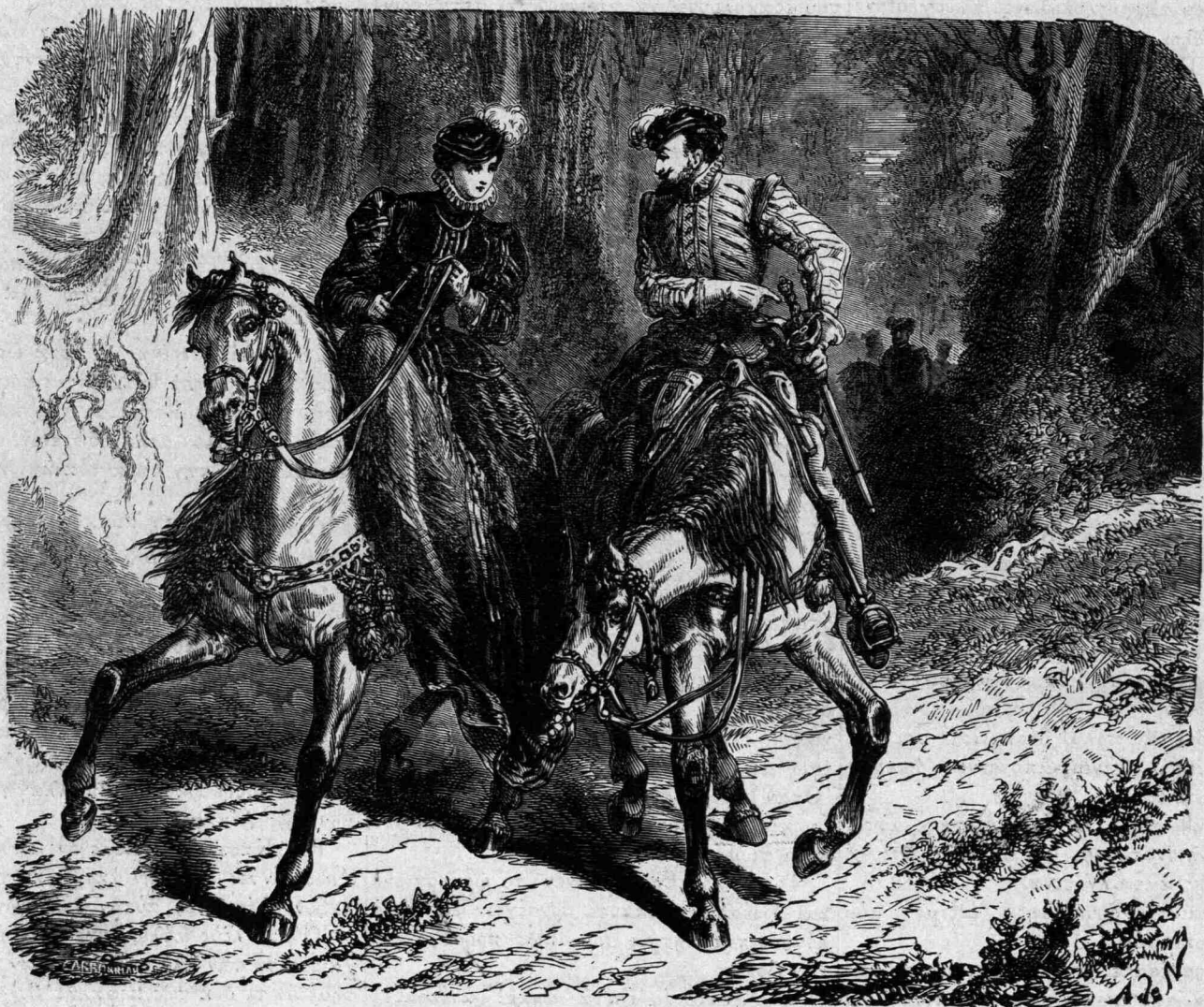
Ἐχω εἰς τὴν πλευρὰν ἀξιολογὸν θρησκευτικὴν ἰσπανικὴν μάχαιραν. [Σελ. 147].