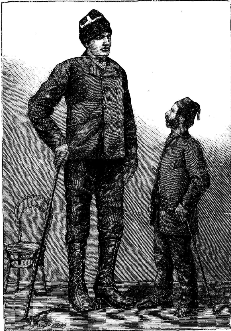
Ὁ Ἕλληγν Γίγας Ἀμάθης.

ξηπίαση τὸν κόσμον ἐν ταῖς ἡμέραις ἡμῶν καὶ διὰ τῆς παραγωγῆς γιγάντων. Ἐκτὸς τοῦ Κουταλιανοῦ, τοῦ ὁποῖου τὴν τεραστίαν δύναμιν οἱ μικροί μας ἀναγνώσται τῶν Ἀθηνῶν καὶ Πειραιῶς εἶδον ὀφθαλμοφανῶς, ἀνεφάνη ἐπ' ἐσχάτων καὶ ἕτερος διάσημος οὐχὶ τόσοσὸν διὰ τὴν σωματικὴν βώμην ὅσον διὰ