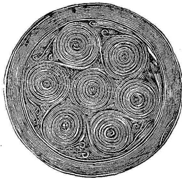
Δίσκοι χρυσοὶ ἐκ Μυκηνῶν. (Ἴδε προηγούμενον φύλλον.)

ρον πλῆθος κοσμη- μάτων χρυσῶν καὶ λιθοκολλήτων. Ἡ τέχνη μὲ τὴν ὁποί- αν εἶναι ἐπεξεργα- σμένοι οἱ δίσκοι εἶ- ναι ἀληθῶς θαυμα- σία ἄπορον δ' εἶναι πῶς οἱ προϊστορι- κοὶ χρυσοκόμοι τῶν Μυκηνῶν ἐξεπέπω- νον τὰ ὄρατα καὶ κανονικώτατα ταῦ- τα σχήματα ἐπὶ τοῦ λεπτοῦ χρυ- σοῦ, ἐκτὸς ἐὰν εἴ- χον ἐργαλεῖα ἐπί- σης λεπτὰ καὶ ἐν- τεχνα, ὅσον τὰ ἄ- ριστα ἐφευρήματα τῆς σημερινῆς μη- χανικῆς.