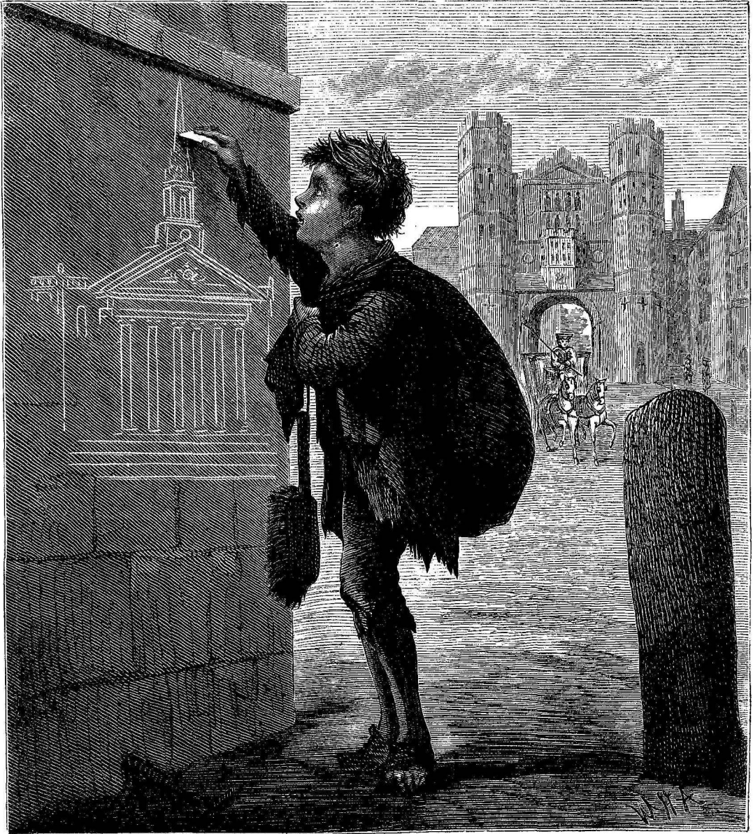
Ὁ μέλλων διάσημος Ἄγγλος ἀρχιτέκτων Ἰσαὰκ Οὐέαρ.

νά ζητῆ ἐλεημοσύνην. Εἶχεν ὁμως πολλὴν κλίση εἰς τὴν ζωγραφικὴν καὶ ὁσάκις δὲν εἶχεν ἐργασίαν ἔσπεκε καὶ ἐζωγράφιζε μὲ κιμωλίαν ἐπάνω εἰς τοὺς τοίχους διάφορα κτίρια τοῦ Λονδίνου, τὰ ὅποια τῷ ἤρθεσκον,