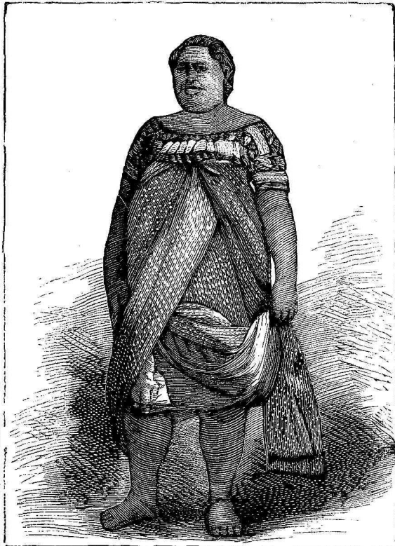
Ἡ ἐγγονὴ τοῦ βασιλέως Γεωργίου

Οἱ κάτοικοι τῶν νήσων Τόγκα ἐδιοικῶντο ἐκάστη ὑπὸ ἰδίου ἀρχηγοῦ, ἐσχάτως ὁμοῦ ἠνώθησαν ὑπὸ τὸ σκήπτρον τοῦ βασιλέως Γεωργίου, ὅστις παρίσταται εἰς τὴν πρὸς τὰ ἀριστερὰ κειμένην εἰκόνα. Ὁ βασι-