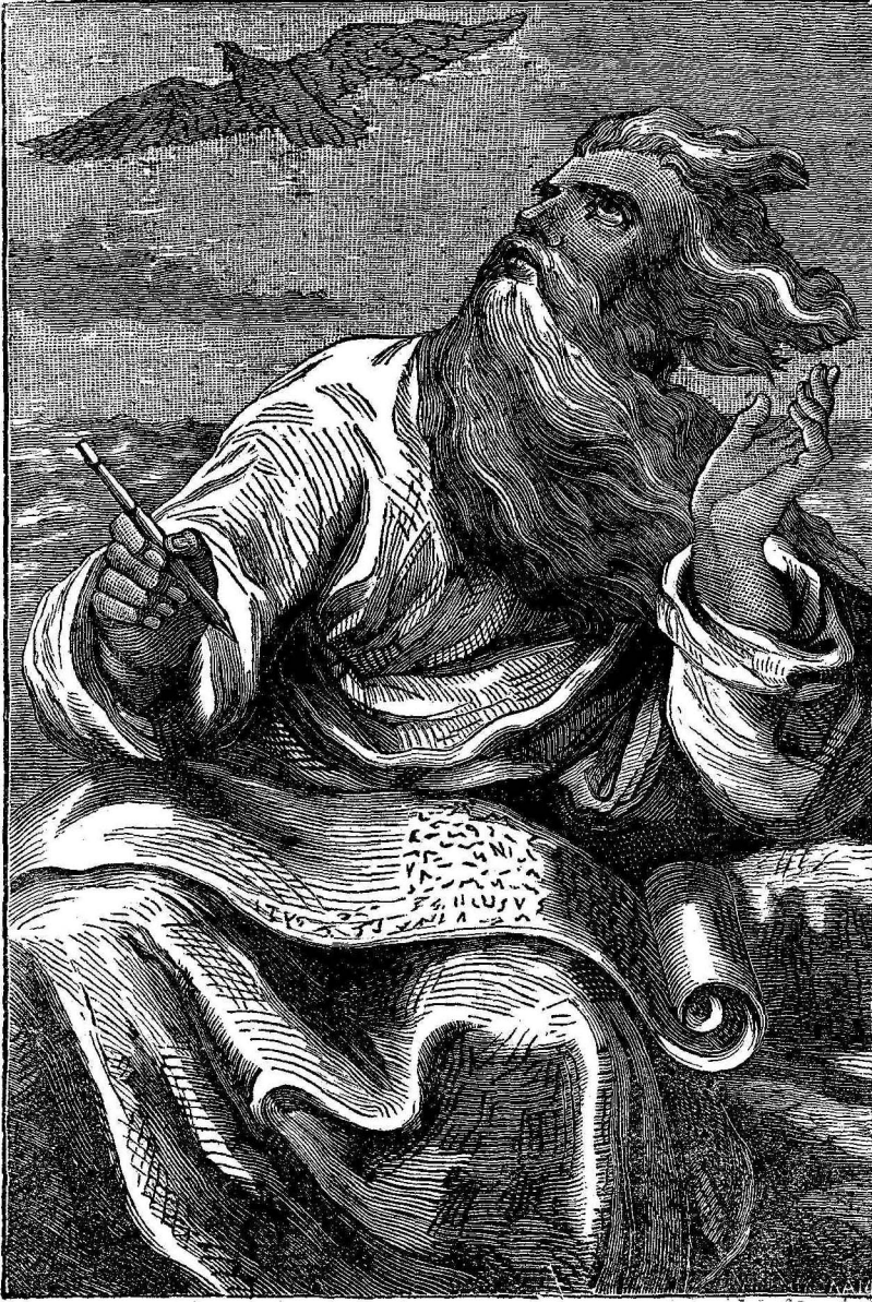
Ἰωάννης ὁ Εὐαγγελιστὴς γράφων τὸ Εὐαγγέλιόν του.

ἐξεῖχε προσέτι κατὰ τὴν ταπεινοφροσύνην, τὴν πραότητα καὶ τὸν ὑψηλὸν βαθμὸν πνευματικότητος. Τοσοῦτον δὲ ἦ τοῦ Χριστοῦ ἀγάπη ἢ το ἐρριζωμένη ἐν τῇ καρδίᾳ του ὥστε ἑκατοντότης ὦν καὶ μὴ δυνάμενος νὰ περιπατῇ ἢ νὰ ἑμιλῇ ἐφέρετο ἐπὶ καθίσματος εἰς τὴν ἐκκλησίαν, καὶ ἐπανελάμβανε τὴν φράσιν, «Γενναῖα, ἀγαπᾶτε ἀλλήλους.»