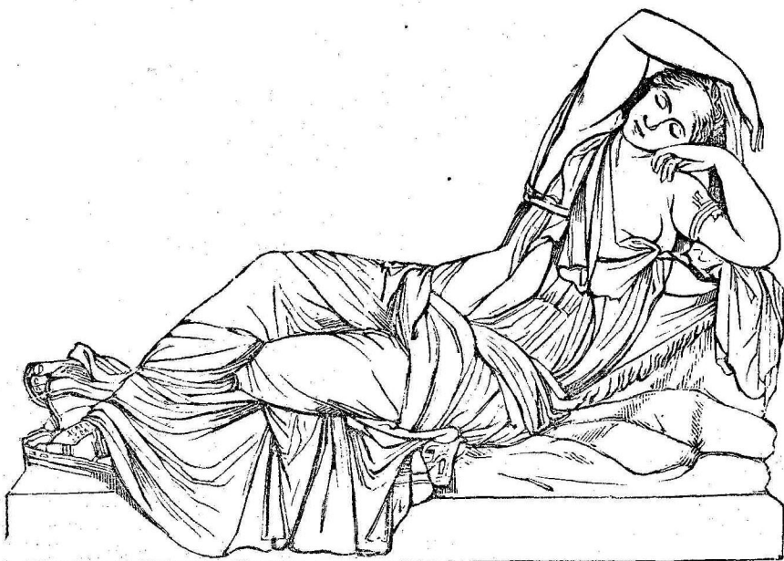
Ἡ Ἀριάδνη κοιμωμένη.

Εἰς οὐδένα, ἐκτὸς τῶν τακτικῶν αὐτῆς ἀνταποκριτῶν, στέλλεται ἡ Ἐφημερίς τῶν Παίδων ἄνευ προπληρωμῆς.