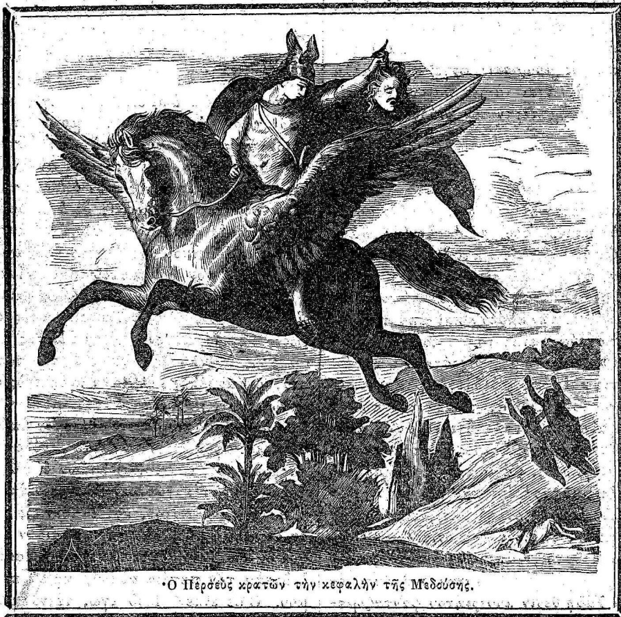
• Ο Περσεὺς κρατῶν τὴν κεφαλὴν τῆς Μεδούσης.

Δικαστὴς τις φιλάργυρος, ὁ ὁποῖος ἠγάπα πολὺ τὰ δῶρα καθήμενος εἰς τὴν οἰκίαν του