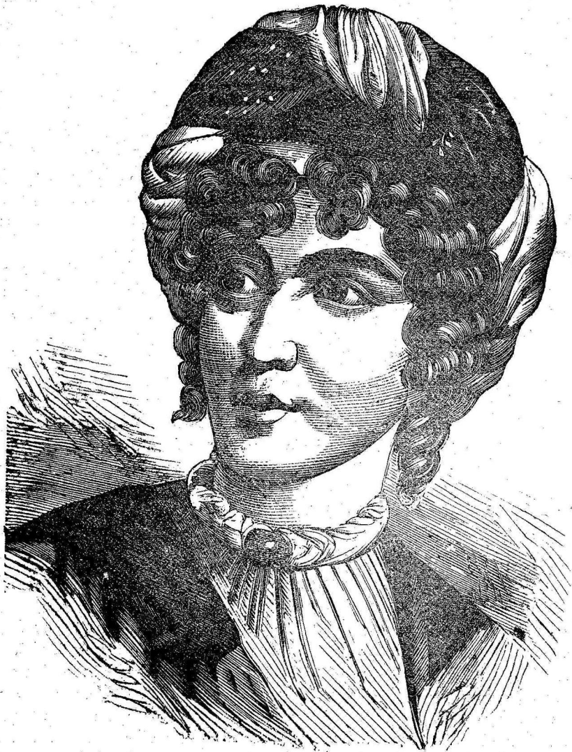
Ἡ ΚΥΡΙΑ ΔΕ ΣΤΑΕΛ

Τὸ 16ον ἔτος τῆς ἡλικίας της ἔγραψε φιλοσοφικὸν ἄρθρον περὶ νόμου, καὶ μετὰ τοῦτο ἔγραψε περὶ διαφορῶν ὑψηλῶν ἀντικειμένων.