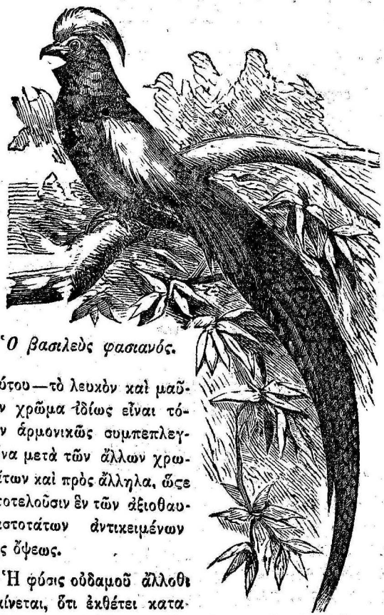
Ὁ βασιλεὺς φασιανός.

Εἶναι δύσκολον νὰ περιγράψῃ τις ἀρκούντως τὴν ὠραιότητα καὶ λαμπρότητα τῶν πτερῶν τοῦ πτηνῆ