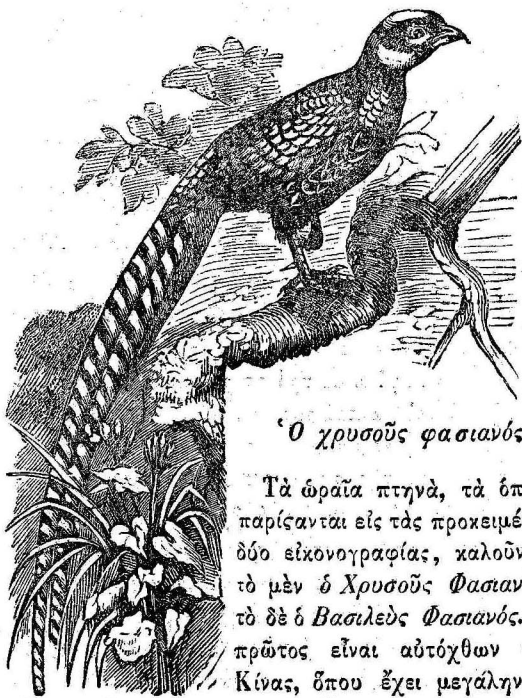
Ὁ χρυσοῦς φασιανός

Τιμὴ ἑτησία, Ἀθηνῶν Δρ. 1— Ἐπαρχιῶν » 1,20 Τουρκίας » 2—