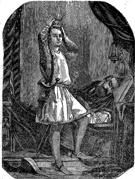
Ὁ Πρίγκηψ Ἑρρίκος δοκιμάζων ἐπὶ τῆς κεφαλῆς του τὸ στέμμα τοῦ πατρὸς του.

Τὸ κρέας τοῦ ἐπὶ τῆς βράχειός του κορτώματος, τὸ ὅποιον εἶναι σχεδὸν τόσον ὑψηλόν ὡς τὸ τῆς καμήλου, θεωρεῖται ὑπὸ τῶν ἐντοπίων ὡς τρυφερώτατον καὶ νοσιμώτατον. Τὰ ζῶα ταῦτα εἶναι πολὺ ἄγρια καὶ περιπλανῶνται ἀγεληδόν· συλλαμβάνονται δὲ εἰς λάκκους ἐπιτήρες ἐσκαμμένους ὑπὸ τῶν κυνηγῶν πρὸς τὸν σκοπὸν τοῦτον.