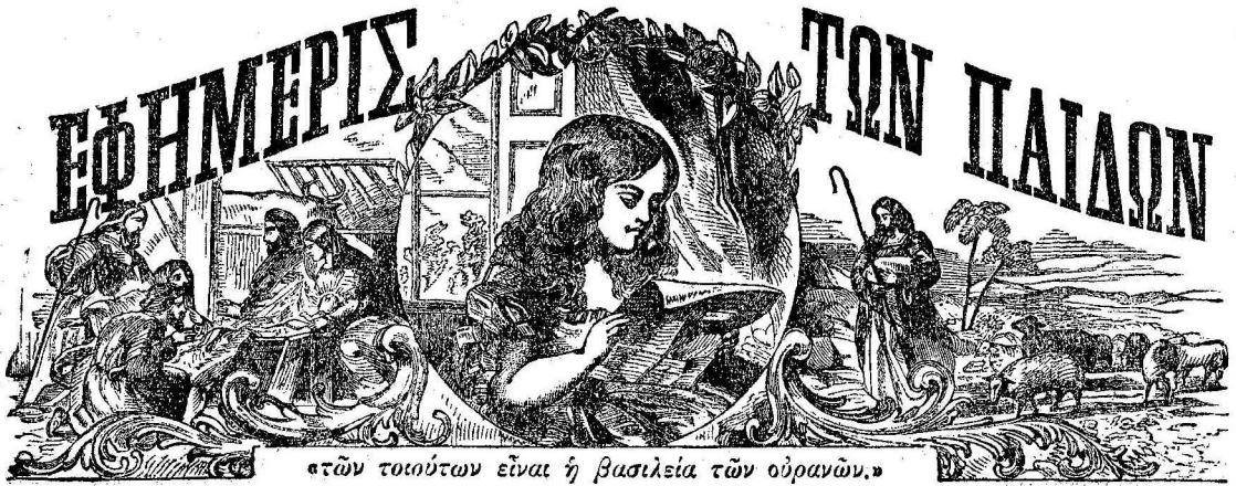
«τῶν τοιοῦτων εἶναι ἡ βασιλεία τῶν οὐρανῶν.»