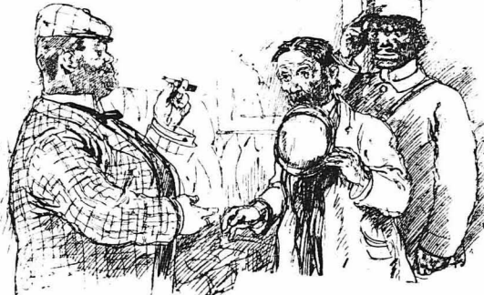
'Έδωσε το χέρι του στον άποσβολωμένο Μπλάκ.