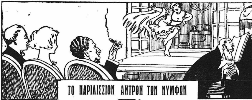
ΤΟ ΠΑΡΙΣΣΙΟΝ ΑΝΤΡΩΝ ΤΩΝ ΝΥΜΦΩΝ

Ένα Ίστορικό Θέατρο. Αι Κόραι του Βορρά. Τί γράφει ο χρονογράφος τής εποχής. Οί ποιηταί τής εποχής. Οί «τσουμπλες». Ο Ζάν Μορεάς εις τό «'Αντρον τών Νυμφών». Ένα ποιήμα του. Ο Ξετρελλαμδς τών γέρον. Ο δικηγόρος Στεφανίδης. Οί θερμαινόμενοι τών 'Αθηναίων. Αποσπάσματα χωροφυλακής πού συνοδεύουν τας ήθοποιούς στά σπίτια των. Η άπαγωγή τής Γαλλίδος χορευτρίκι. Διπλωματικόν επεισόδιον κλπ.