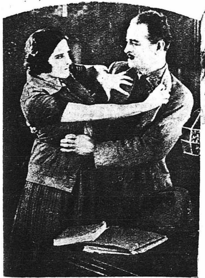
Ἡ Ἀλίκη ἀπέκρουσε τὸ Λαζαράκ.

Ἀπεργίες καὶ στάσεις εἶχαν ὀργανωθῆ σὲ ὅλο τὸν κόσμον ἀπὸ τὸ κόμμα πού ἀνήκε ὁ Ζὸν-Λουὶ Βερντιέ, στὸ ὁποῖο