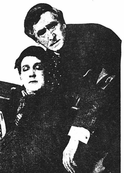
Μιὰ μεγάλη χαρὰ κατεῖχε τοὺς δικούς του πού τὸν ἐβλεπαν θεραπευμένο καὶ μετανοημένο.

Τότε ὁ καθηγητῆς φάναξε ἀπὸ τὴ θέση του. — Θὰ ἡρνεῖτο τόχα ὁ δμιλητῆς ν' ἀναγκασθῆ τὸν πατέρα του γοὶ τὴ μητέρα του; Μιὰ σιωπὴ ἀπλώθηκε στὴν ἀρχή, μὰ κατόπι ὁ πατέρας καὶ ὁ γιὸς του χωρὶς ὁ τελευταῖος ν' ἀναγκασθῆ τὸ συνομιλητῆ του ἔρχισαν μιὰ ζωηρὴ συζήτηση. Σὲ λίγο ὅλη ἡ συγκέντρωση ἔσχισε νὰ μιᾶει καὶ νὰ προβῆ σ' ἐδηλώσεις κατὰ τὸν καθηγητῆ. Τότε ὁ Ζὸν-Λουὶ βέβηκεν ὅτι ὁ ἀγνώστος τὸν ὁποῖον ἀντίχρῆσε νινδύνει, θῆλῆσε νὰ τὸν ὑπερασπισθῆ, μὰ εἰ συντροφοὶ του τὸν ἐχτύπησαν καὶ τὸν ἐξάπλωσαν