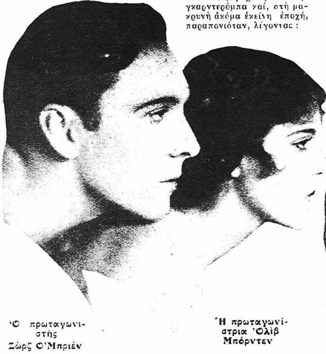
Ὁ πρωταγωνιστὴς Ζῶρς Ὁ Μπριέν

Μά, μ' αὐτὰ, σιγὰ σιγὰ τὸ σπῆτι τῆς ἔπαψε νάχη γοητεία γι' αὐτή. Μιά ἡμέρα ὁ Ἄδὰμ γιὰ νὰ εὐχαριστήσῃ τὴν Εὐὰ τὴν ὁποία