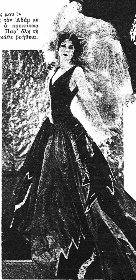
Ἡ Εὐὰ φοροῦσε τὰ ὡραιότερα μοντέλλα τοῦ Καταστήματος.

Τὶ θέλατε ὑστερ' ἀπ' αὐτὰ νὰ κάνῃ ὁ Ἄδὰμ. Συγχώρησε τὴν Εὐὰ καὶ ἔφυγε μαζὶ τῆς θριαμβευτικὰ ἀπὸ τὸ Κατάστημα τοῦ Ζοζέφ Ἄντρέ.