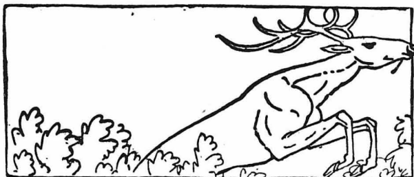
ΤΗΣ ΜΟΙΡΑΣ ΤΑ ΓΡΑΜΜΕΝΑ