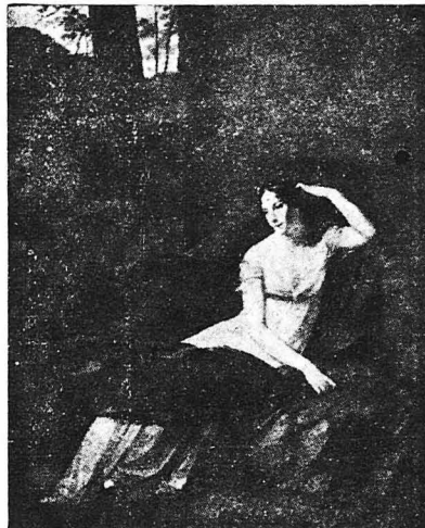
Ένα περίφημο πορτραίτο της Ίωσηφίνας.