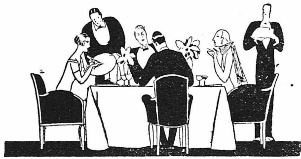
ΑΠΟ ΤΗ ΖΩΗ ΤΩΝ ΣΥΓΓΡΑΦΕΩΝ