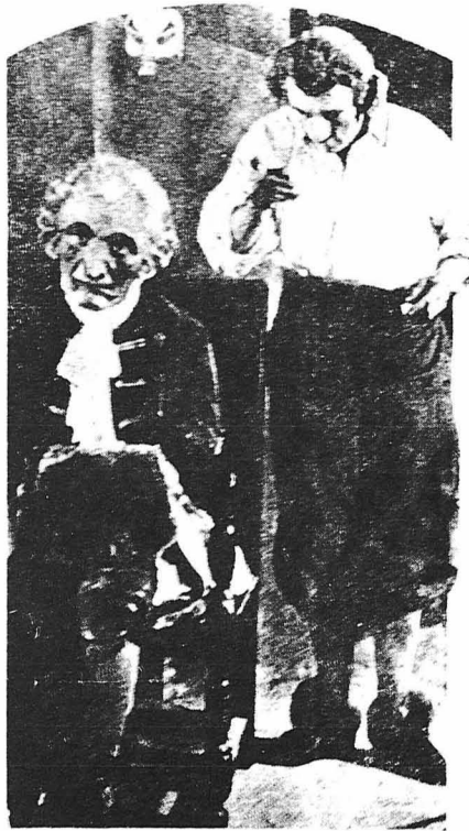
Ο βρωμνος και Κελεπέν κινεσκαλός αυτόματα.