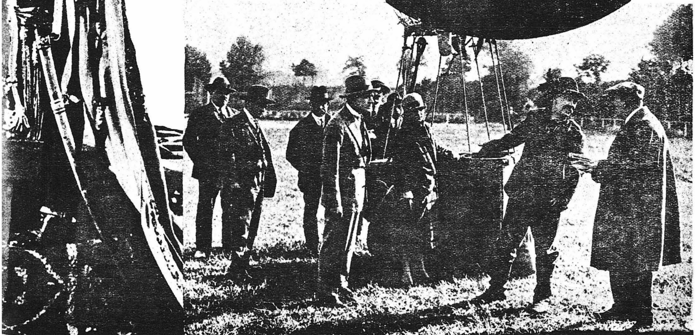
οιλεὺς τῆς Σεττονίας.