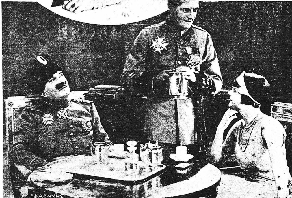
Ο νέος βασιλεύς έπερνε τό ταξί του με τόν πρίγκηπα και τήν πριγκήπισσα.