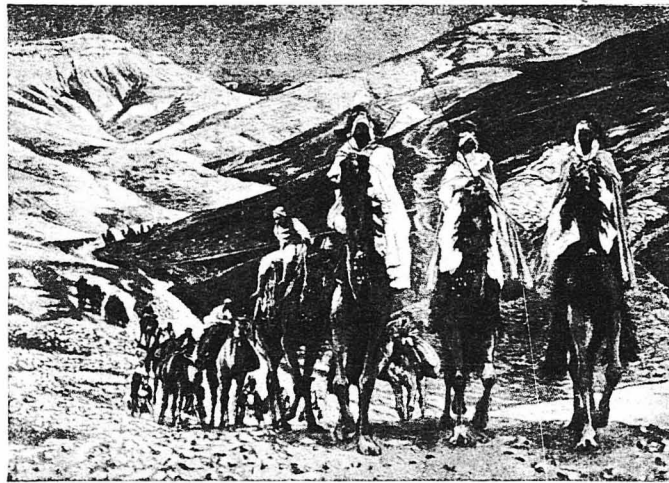
Τὸ ταξίδι τῶν μάγων. (Πίναξ τοῦ Τζέιμς Τισσό).

Αὐτὴ εἶνε ἡ παράδοση τῶν τριῶν Μάγων μὲ τὰ δῶρα. Μά οἱ