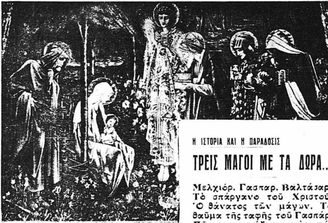
Τὸ προσκύνημα τῶν Μάγων. (Πίναξ τοῦ Μπρόν-Τζόν).