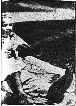
οὐ κήπου τοῦ Βερολίνου, ἰστά παιδιά τῶν φυλάκων.