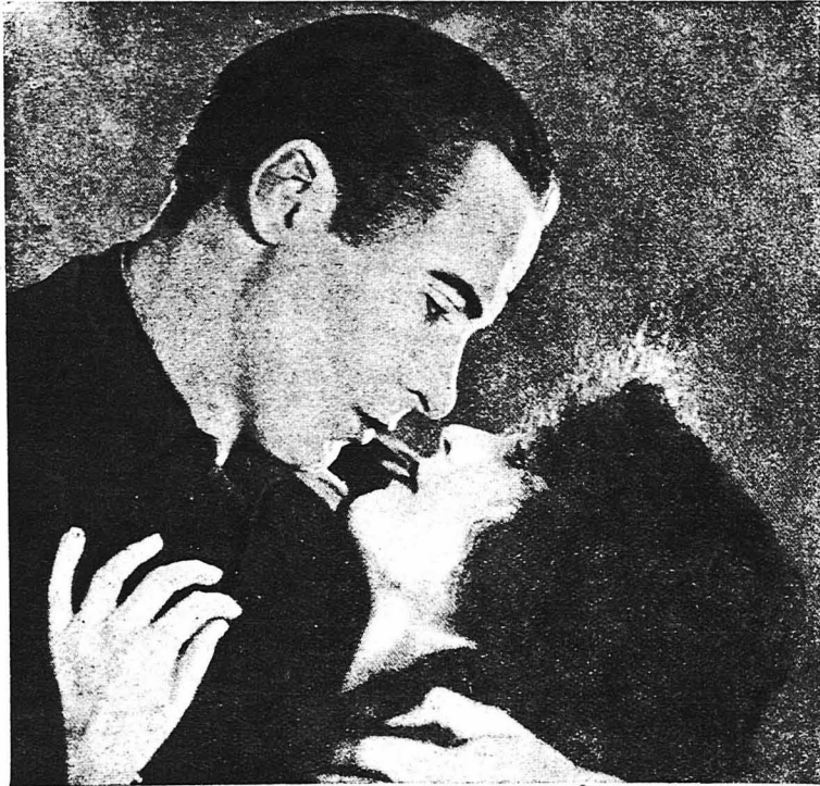
Οί διάσημοι ηθοποιοί Ρόντ λὰ Ρόκ' και Σακελίνα Λογκάν, οί όποιοί έχουν εξιδανικεύσει την τέχνη του φιλήματος στον κινηματογράφο.