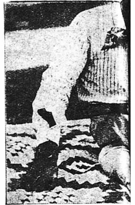
"Ένας χιμπατζής του : δ όποίος κάνει και χρέ