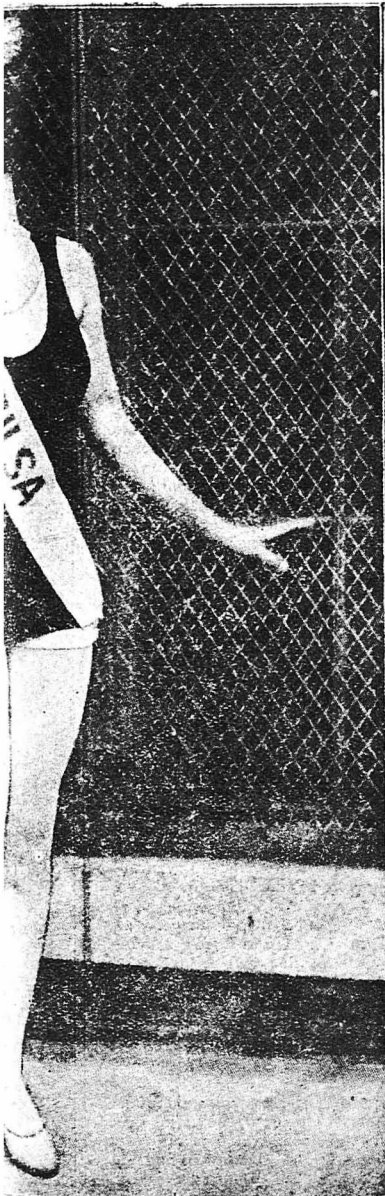
υθεῖσα στον διαγωνισμό καλλονῆς τοῦ οἶον ἔλαβον μέρος ἀντιπρόσωποι τοῦ ας τῶν Ἠνωμένων Πολιτειῶν.