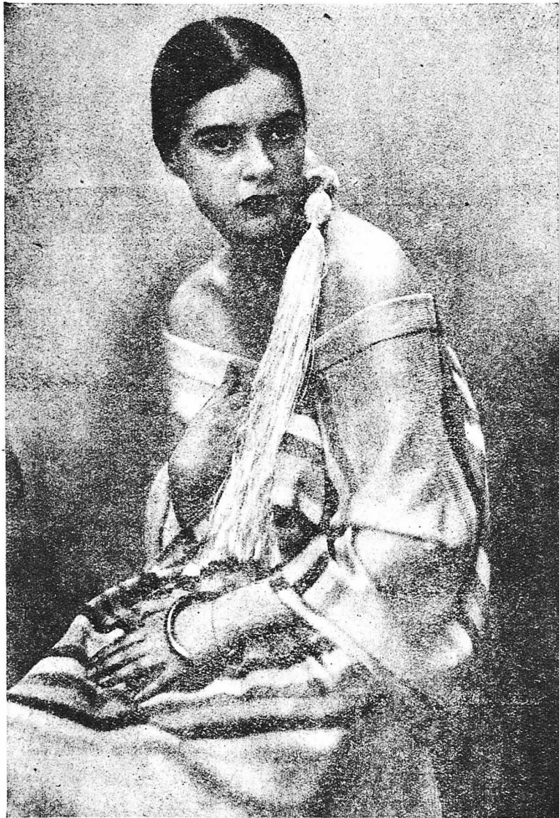
Μιά νεαρά Βερολινέζα ἀριστοκράτις ἡ ὁποία θαυμάζεται γιὰ τὴν ὀμορφιά της.