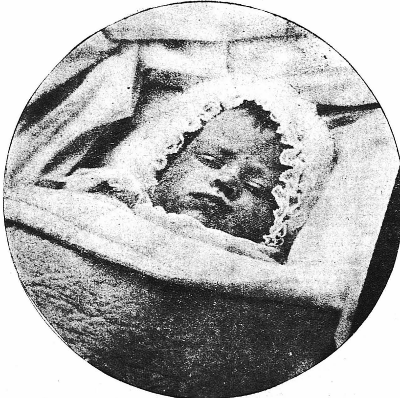
'Η πρώτη φωτογραφία της πριγκηπίσσης 'Ελισάβετ, θυγατρός του δουκός της 'Υόρκης και έγγόνης του Βασιλέωι της 'Αγγλίας, ή όποία, όταν έλήφθη ή φω- τογραφία, ήτο ήλικίας μόλις μιās ήμέρας.