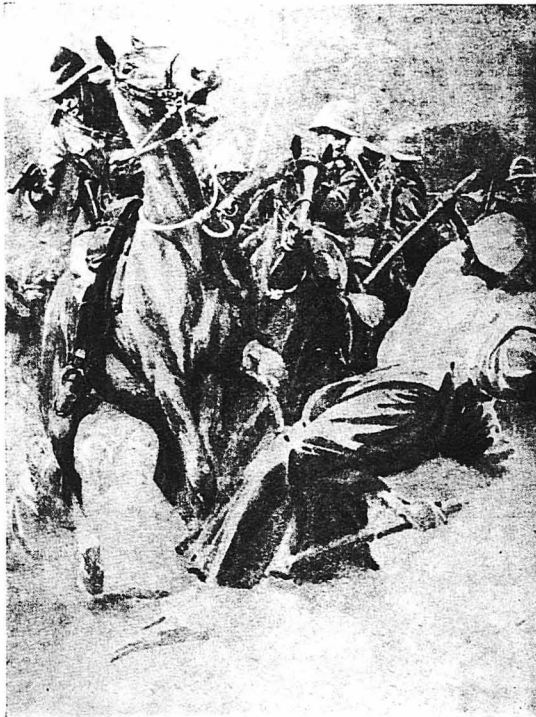
Έβλεπε πολέμους, μάχες...