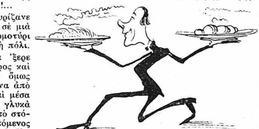
Τά γκαροόνα τού έφεγγαν ότι ποθοῦσεν ή καρδιά του.