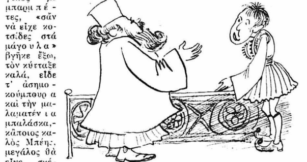
— Ποιός τόν έφρασε, ειπες μωρέ;

Τού ειχε άνεβή τό αίμα στο κεφάλι, όταν ένας κοντός και στρουγγυλός με μακριά πέτες, «σάν να ειχε ζοτιδες στα μάγο υλα» βγήκε έξω, τόν χτύπαξε καλά, ειδη τ' άσημο-ζομπύπουρα και τήν μαλιαματένια και μιλαδάσα, ζάποιος καλός Μπέης, μεγάλος θά εινε σκέφθηκε και άρχισε να σούβη και να τόν κλωσορήση: