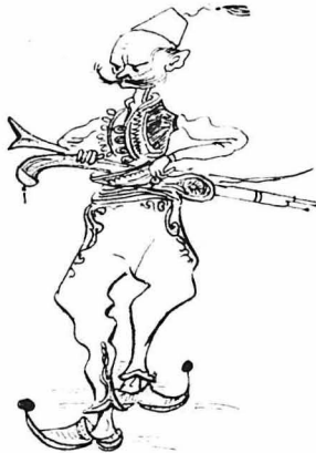
Άλλη - Τουζλούκας - Πλιάτσικας.