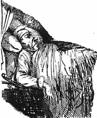
'Ο Κανταράς όλο κοιμώτανε.