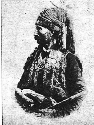
Ἐνας ἀπὸ τοὺς Ἄλβανούς σωματοφύλακας τοῦ Ἄλῃ.

Ὁ Ἄγγλος συνταγματάρχης Ἄλν, ποῦ περηγῆθῃ τὴν ἐποχὴ ἐκείνη τὴν Ἡπειρο, γράφει στὸ τετράτομο βιβλίον του τὰ ἀκόλουθα σχετικά : «Δείγμα ἰδιαιτέρας εὐνοίας τοῦ Σατράπου θεωρεῖται ὅταν ἀπὸ τὸ χαρέμι του προσφέρει ὡς σύζυγον μιάν ἀπὸ τῆς ἐρωμένες του σὲ ἐκεῖνον ποῦ θέλει ἐξαιρετικῶς νὰ τιμῆσῃ... Γιὰ τὴν τιμὴ αὐτὴν παρὰ λίγο νὰ τρελλαθῇ ἀπὸ τὴν χαρὰ του ἕνας φίλος μου Ὁθμανός, γραμματέας τοῦ Ἄλῃ, ὁ ὅποιος ἔλαβε ὡς δῶρο μιὰ περικαλλεστάτη Κιρκάσιαν. Ἀπεναντίας, δὺ Ἄλβανοὶ ἐπέπεσαν νὰ παντρευτοῦν πρὸ τῆς ὄρας, γιὰ νὰ μὴν ἀναγκασθοῦν νὰ λάβουν ἕνα τέτοιο δῶρο. Ἦσαν δὲν ποῦ καλὰ ὅτι ἡ ἀρνησις ἐσημῆνε καταστραφῆ.»