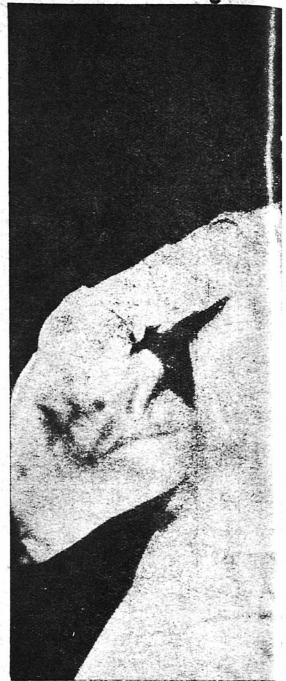
Η Αικατερίνη "Έσλιγκ, η ώραία πρ ζει τόν ρόλον τής Νά...