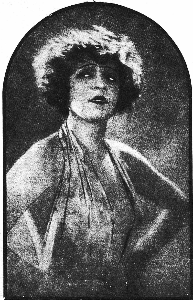
Η Βιεννέζα ηθοποιός Νέλλυ Ούιλκε, μία από τας ωραιότερας ηθοποιούς του κόσμου.