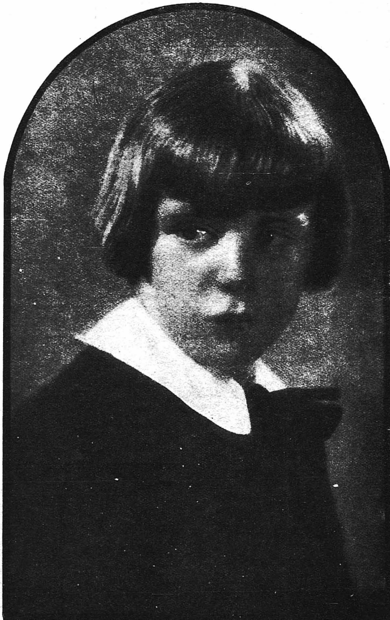
Ο μικρός ήθοποιός του κινηματογράφου Μπούμπυ, ο οποίος συναγωνίζεται τον Κεϋγκαν.