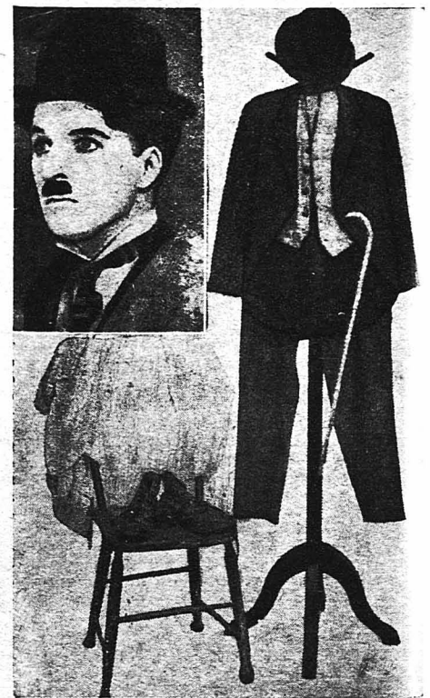
Τό κλασικό... βρεσιτάριο του Σαρλώ. (Θά τό γνώριζε κανείς και χωρίς νά βάλεμε τή φω- τογραφία κλάι)