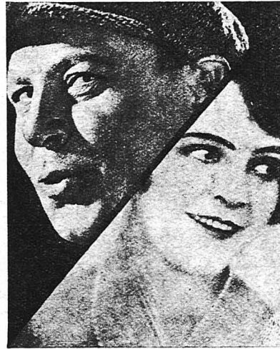
Ο Έμιλ Γιάννινγκς και η Μαίντου Κριστιάνς.