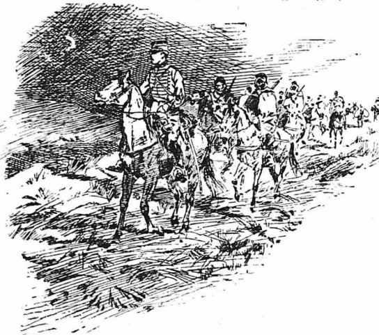
Σὲ λίγο φάνηκε ἓνα ἀπόσπασμα Ζουάβων.

— Μόλις τελειώσαμε τὴ δουλειὰ μ'ας, κύριε συναγματάρχα,