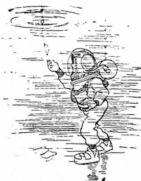
Κά φωνες ψάρια σ' άγκιστρία τών ψαράδων

Υπήρχαν στήν άρχαιοτητα σκυλιά, σπανία, ράτσας που σιόχιζαν όλόκληρες περιουσίες. Άπ' τ'ο παιό άκριβό σκυλιά είταν κι' ό περιφραμος σκύλος τού Άλκιβιάδη. Τόν άγόρασε έβδομύνητα «μνάς! Είταν, ως φαίνεται, θαυμάσιος και άπό άπόψεως μεγέθους και άπό άπόψεως ράτσας. Τού σκύλου αύτού, ως γνωστοί, ό Άλκιβιάδης έκωψε τήν ουρά γιά να προκαλέση τήν κατάπληξη τών Άθηναίων.