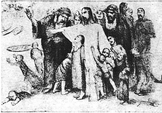
*Άφησε τά παιδιά νάρθουν κοντά μου.

— Ο Διδάσκαλος λέει, άπάντησε τò παιδι, ότι ο άνθρωπος πρόπειν' άφήνη τόν πατέρα του και τήν μητέρα του και νά τόν άκολουθεί.