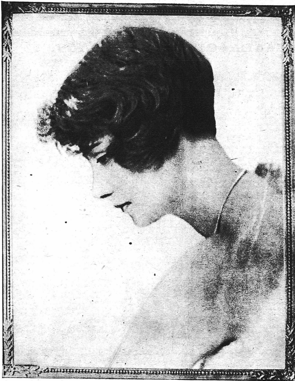
Ἡ Ἀγγλὶς ἠθοποιὸς Φάιθ Τσέλυ, ἡ ἀγαπημένη τοῦ Λονδίνου.