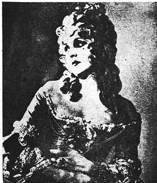
Ἡ γνωστὴ καλλιτέχνης τοῦ κινηματογράφου Λία ντέ Πούτι, ὡς Περμπαντούρ.