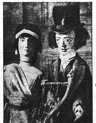
Ἀντρείκελλα τοῦ μεγάλου ποιητοῦ Μισσέ καὶ τῆς μυθιστοριογράφου Γ. Σάνδη.