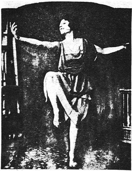
Ἡ διάσημος χερεῦτρια Ξαν Ἐλφλιχ ἀσκευ- μένη εἰς τὴν καθημερινὴν χερευτικὴν τῆς ἐκγυμνασίῳ.