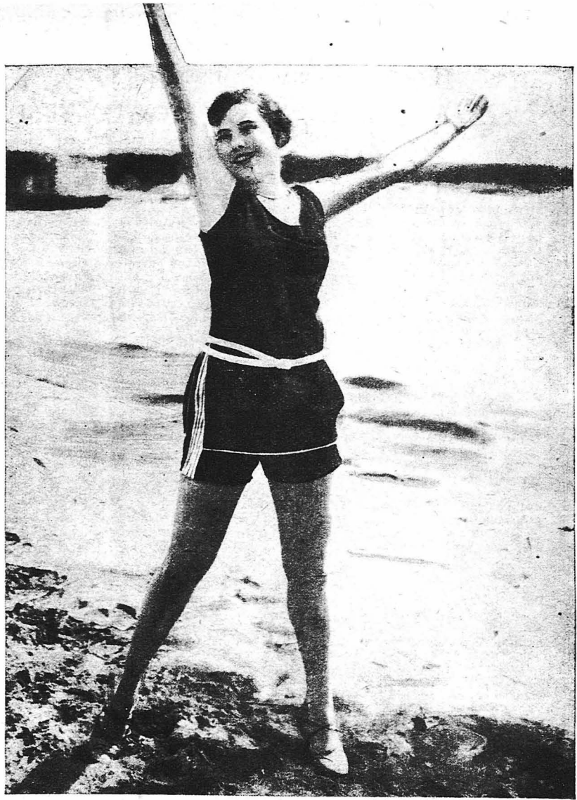
Ἄγγλις ἀριστοκράτις στὰ λουτρά τοῦ Μπιαρρίτζ.