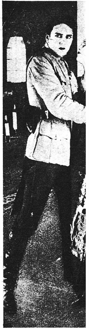
Ὁ Γιάτλαιν καὶ ἡ Ἔμμα Λύνεστόνα ἰλιγγονοῦ τοῦ Σαρλ Μερρέ, ὅπου πρωταγωνιστοῦν μὲ μεγάλην ἐπιτυχίαν.