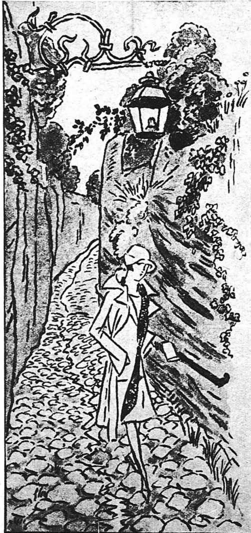
'Ηταν ακόμη παιδί πράγμα...